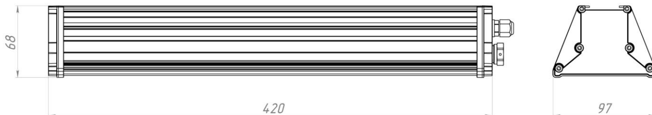
Рисунок 1. Внешний вид на вариант светильника.